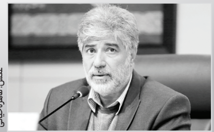
عکس نظاره‌گری محبتی

او تصریح کرد: مرحله دوم خسارت، کیفی است و پوره‌ها از دانه تغذیه می‌کنند. بنابراین