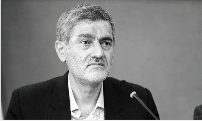
عکس نظاره‌گری محبتی

در حوزه آبریز دریاچه‌های بختگان و طشک را در اولویت اقدامات دانست و تصریح کرد: اصلاح الگوی کشت، اصلاح اشتغال، عدم توسعه زمین‌های کشاورزی، پلمپ چاه‌های غیر مجاز، نصب کنتورهای هوشمند، لایروبی آبرها و کاهش تبخیر هر کدام نقشی در احیای تالاب‌ها دارد که می‌بایست سهم هر کدام به صورت مشخص ارائه شود و برنامه‌ها برای رسیدن به آنها نیز اجرایی گردد.