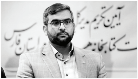
آیین گزیننده کتاب‌خوانی جشنواره کتاب‌خوانی رضوی در استان فارس

این اختتامیه جشنواره کتاب‌خوانی رضوی در استان فارس با معرفی و تقدیر از ۱۷۱ برگزیده این جشنواره در کتابخانه موقوفه کاظمی شیراز برگزار شد.